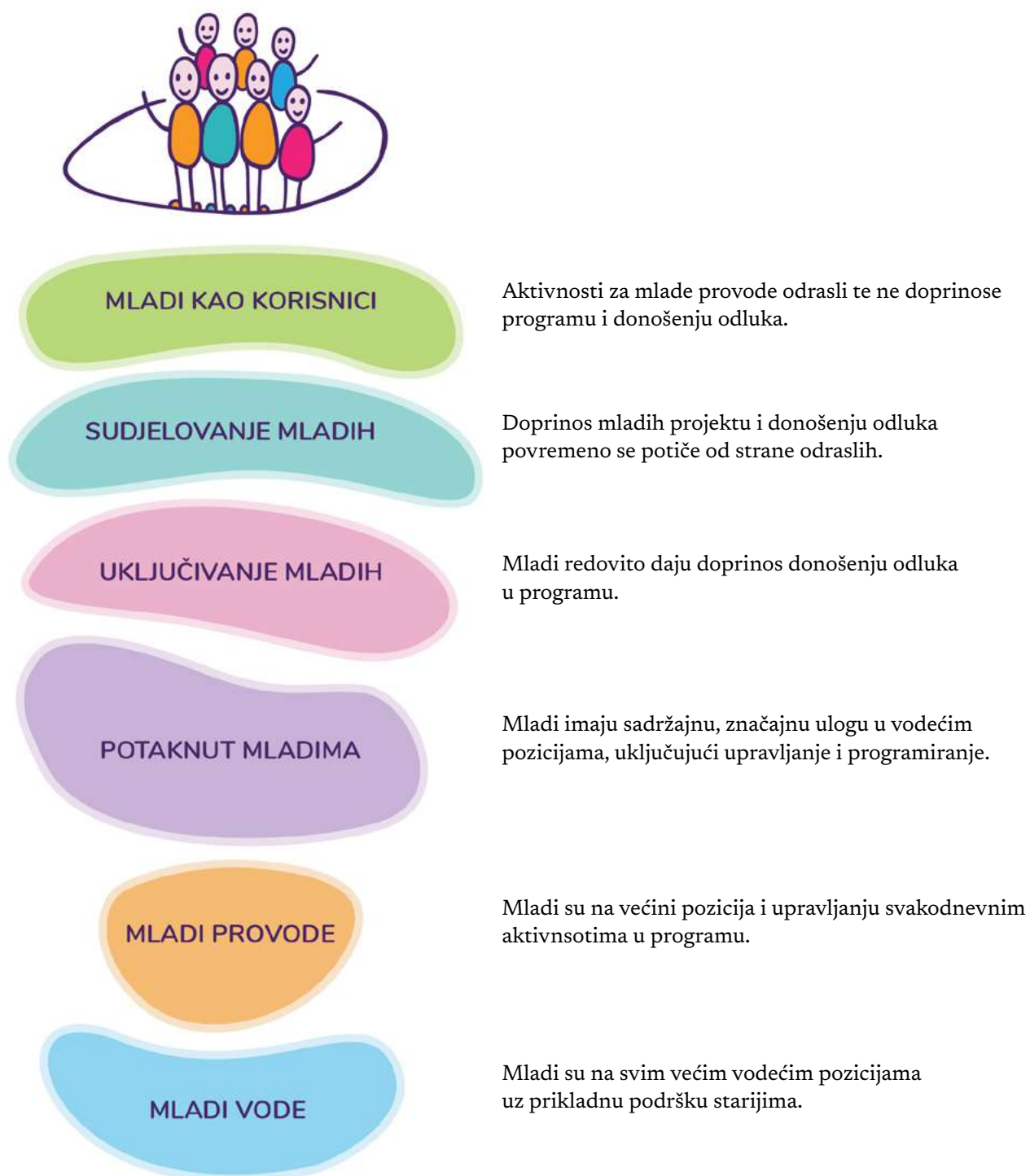
Slika 1. Spektar vodstva mladih

Mladi trebaju u što većoj mjeri biti uključeni u planiranje, provedbu i evaluaciju učenja zalaganjem u zajednici. Trebali bi projekt/aktivnost smatrati svojim vlasništvom te biti voditelji aktivnosti, a ne samo njihovi provoditelji. To od radnika s mladima zahtijeva da stvara prilike i motivira mlade na vodstvo. Najvažnije je poštovati ideje i namjere mladih ljudi. Ako su mladi osobno uključeni u pripremu i implementaciju, osjećat će i veću odgovornost za provedbu zadataka jer su ih sami osmislili. U praksi se to ponovno pokazuje većim izazovom za radnike s mladima umjesto za same mlade ljude. Važno je usmjeravati mlade, slušati ih, ali im i dopustiti da vode. U stručnim publikacijama pronašli smo nekoliko alata koji pomažu pri razumijevanju vodstva mladih kao kontinuuma koji pruža spektar mogućnosti. Jedan od spektara prikazan je na slici 1.